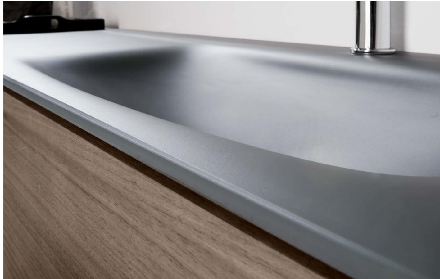
VETRO H1 PIANI IN VETRO LUCIDO O SATINATO CON LAVABI INTEGRATI BUILT-IN GLOSSY OR SATINED GLASS BASINS Falper Design