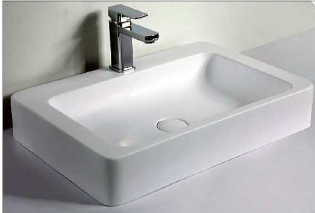
Ablaufgarnitur separat bestellen